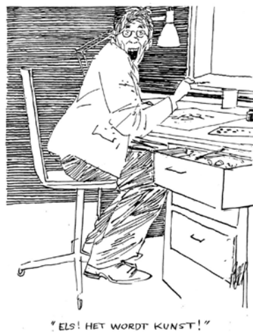
Peter van Straaten

Op de zolderverdieping van de Vleeshal was een greep uit het omvangrijke oeuvre van deze zeer productieve tekenaar te zien. Van Straatens tekeningen en cartoons worden gekarakteriseerd door de wat krasserige wijze van tekenen, waarbij arcering een belangrijke rol speelt. De werken in de zwarte en gouden lijsten waren uit de periode 1980 tot 2000; de tekeningen met houten lijsten van 2001 tot en met voorjaar 2010. Veelvuldig terugkerende onderwerpen in Van Straatens tekeningen zijn conflicten tussen generaties of