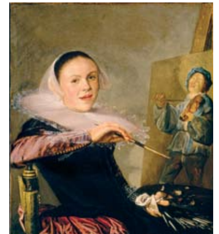
Judith Leyster, Zelfportret

Ter ere van haar 400-ste geboortedag organiseerden de National Gallery of Art in Washington D.C. en het Frans Hals Museum te Haarlem een kleine tentoonstelling van haar beste werken. Centraal stond Leysters meesterlijke Zelfportret (c. 1630), waarin ze zich met verve presenteert als portrettist én schilder van vrolijke gezelschappen. Samen met andere topstukken van haar hand liet de tentoonstelling de ambitie en het talent zien van deze uitzonderlijke schilder.