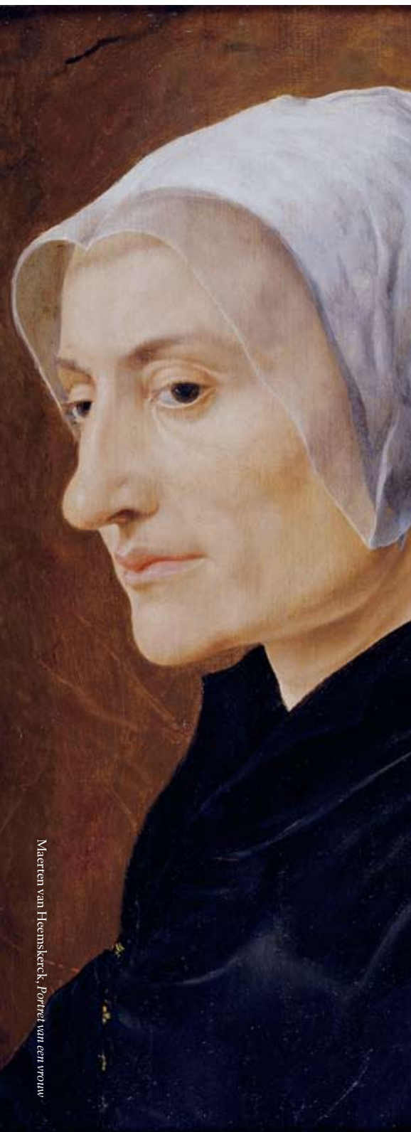
Maerten van Heemskerck, Portret van een vrouw