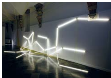
Navid Nuur, Tentacle Thought

Kenmerkend voor de kunst van Navid Nuur is zijn verrassende materiaalkeuze. Zijn sculpturen en installaties stellen het 'aura' van een bepaald materiaal centraal: bijvoorbeeld een sculptuur die is opgetrokken uit zachte blokken oasis of uit smeltende waterijsjes bestaat. Hoewel er steevast een vastomlijnd concept aan de basis van een werk ligt, wordt het maakproces bij hem toch sterk beïnvloed door intuïtie en toeval. Maakplezier en poëzie zijn belangrijke ingrediënten in het