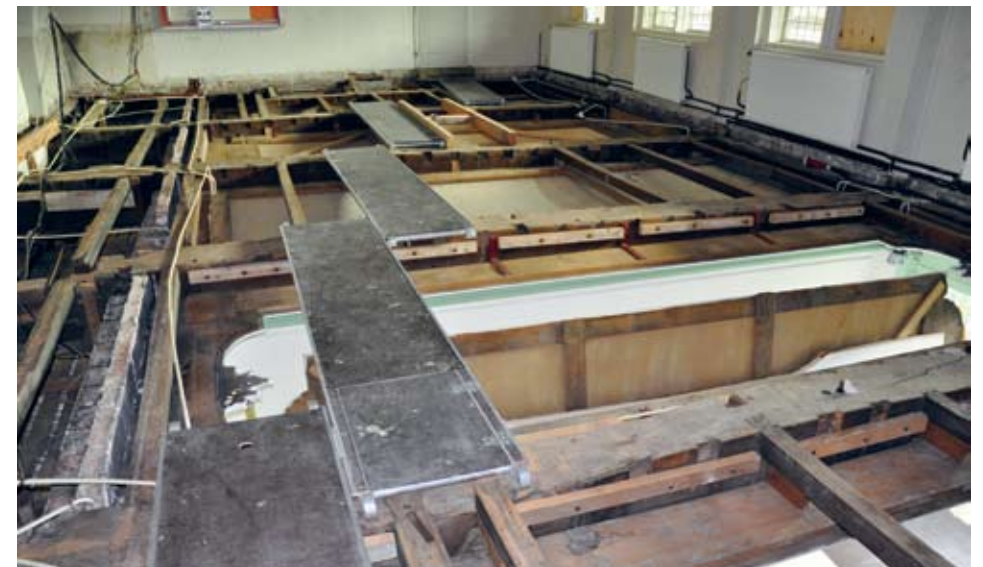
opengewerkt plafond na verwijdering van het asbest

Op het moment dat de zolders ontruimd zijn, kan men beginnen met het saneren van de asbest; dat betekent in de praktijk dat alle leidingen, kabels, wanden, vloeren, plafonds eruit gesloopt worden. Als de ruimten door de daartoe bevoegde instanties