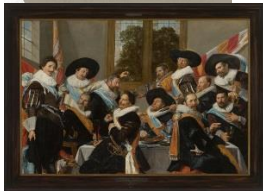
Frans Hals Feestmaal van officieren van de Cluveniersschutterij , 1627 Frans Hals Museum, Haarlem