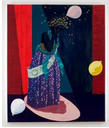
Kerry James Marshall Untitled (Beauty Queen) , 2014 Acryl en glitter op PVC paneel 182,2 x 152 cm © Kerry James Marshall Courtesy de kunstenaar en David Zwirner, Londen