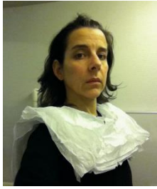
Anton Henning Portrait No. 528, 2018 Olieverf op doek