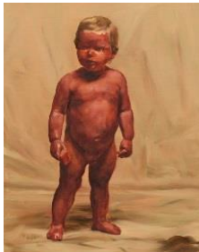
Michaël Borremans Fire from the Sun , 2017 (serie) Olieverf op paneel Courtesy The Ella, Aedan & Darya collection Foto: Peter Cox