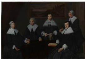
Frans Hals Regentessen van het Oudemanshuis , a. 1664 Frans Hals Museum, Haarlem