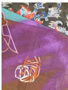
Shezad Dawood The King of France (after Hals, Braque and Raysse) (detail) Acryl en neon op vintage textiel en doek 154 x 119 cm