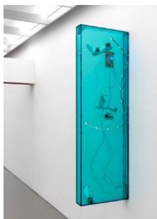
Saskia Noor van Imhoff en Arnout Meijer Second Spade , 2016-17 (serie van 8) Brons, steen, hout, pewter, perspex, glas, gips Courtesy de kunstenaar & Galerie Fons Welters Foto: Gert Jan van Rooij