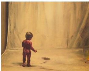
Michaël Borremans Fire from the Sun , 2017 (serie) Olieverf op paneel