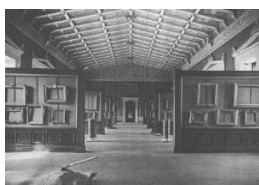
Melvin Moti No Show , 2004 Video installatie