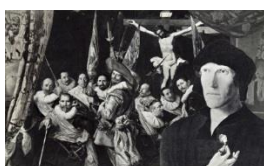
Luuk Wilmering The Civic Guard Portrait Groups , 2015 (een werk in 6 collages)