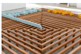
Riet Wijnen Sculpture Sixteen Conversations on Abstraction (detail), 2016 Hout, verf