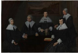
Regentessen van het Oudemannenhuys, Frans Hals, c. 1664. Frans Hals Museum, Haarlem.