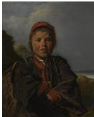
Frans Hals, Vissersjongen , © KMSKA – Lukas-Art in Flanders vzw. Foto: Hugo Maertens