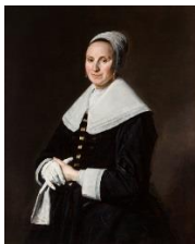
Portret van een dame met handschoenen, Frans Hals , c. 1645/50. Frans Hals Museum, Haarlem.