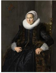
Portret van Cornelia Vooght, Frans Hals, 1631. Frans Hals Museum, Haarlem.