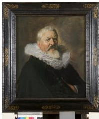
Portret van Pieter Jacobsz Olycan Frans Hals, 1629/30. Frans Hals Museum, Haarlem.