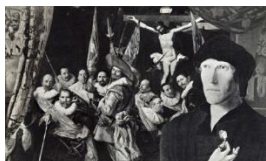
The Civic Guard Portrait Groups - 2015