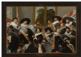
Feestmaal van officieren van de Cluveniersschutterij, Frans Hals , 1627.