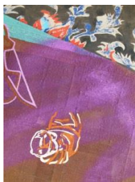
The King of France (after Hals, Braque and Raysse)