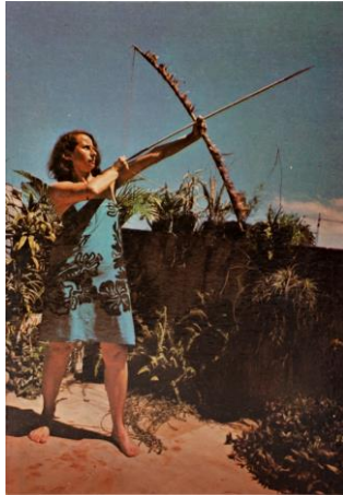
ANNA BELLA GEIGER

Brasil nativo / Brasil alienígena (detail), 1976-1977