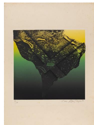
ANNA BELLA GEIGER Sem título (trevas/luz) , 1974 (uit de serie Polaridades/Lunares) Metaal fotogravure, zeefdruk en cliché op papier