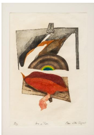
ANNA BELLA GEIGER Carne na tábuá, 1969 Aquatint, ets, reliëf op papier

De vragen die Geiger in haar werk oproept zijn actueler dan ooit. Met deze tentoonstelling daagt het Frans Hals Museum bezoekers uit om anders te kijken naar thema's zoals kolonialisme en emancipatie door vragen te stellen als 'van wie is dit land en wat is mijn positie als vrouw daarin?'.